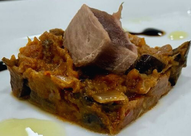
Zaalouk de berenjena con atún. -4