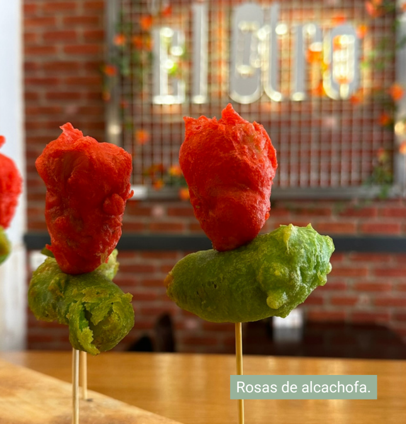
Rosas de alcachofa.